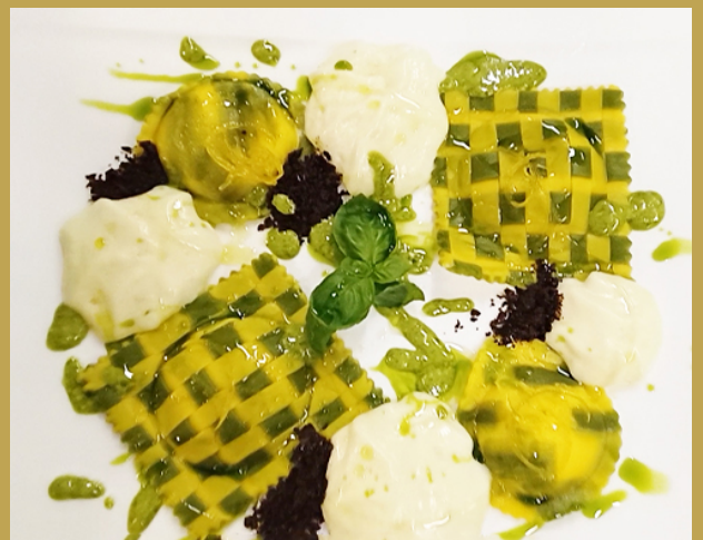
Bottoni di pasta fresca alla ligure »