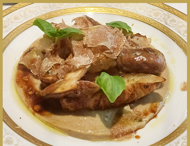
Tuberi e tartufo bianco ai sapori liguri »