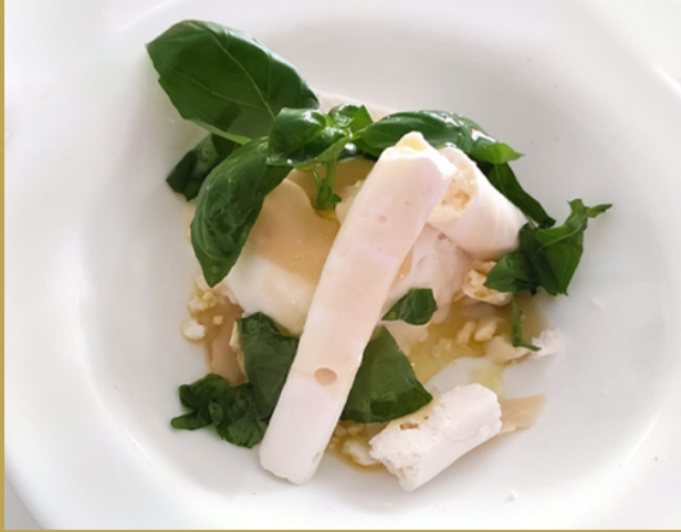
Dolce non dolce »