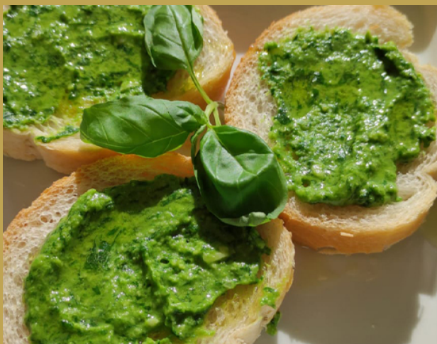
Bruschette al pesto al mortaio »