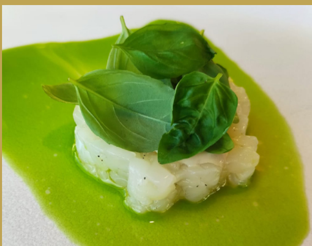
Tartare di seppia all'Olio Riviera Ligure DOP con Basilico Genovese DOP »