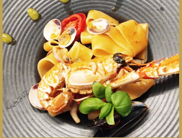
Calamarata di mare ai sapori della Liguria »